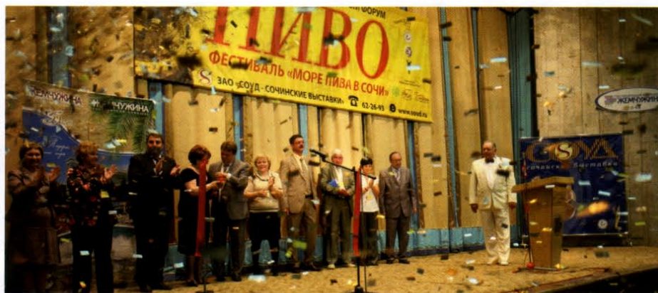
На торжественном открытии в киноконцертном зале звучали поздравления и пожелания